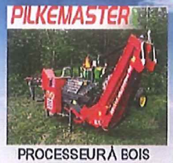
PROCESSEUR À BOIS